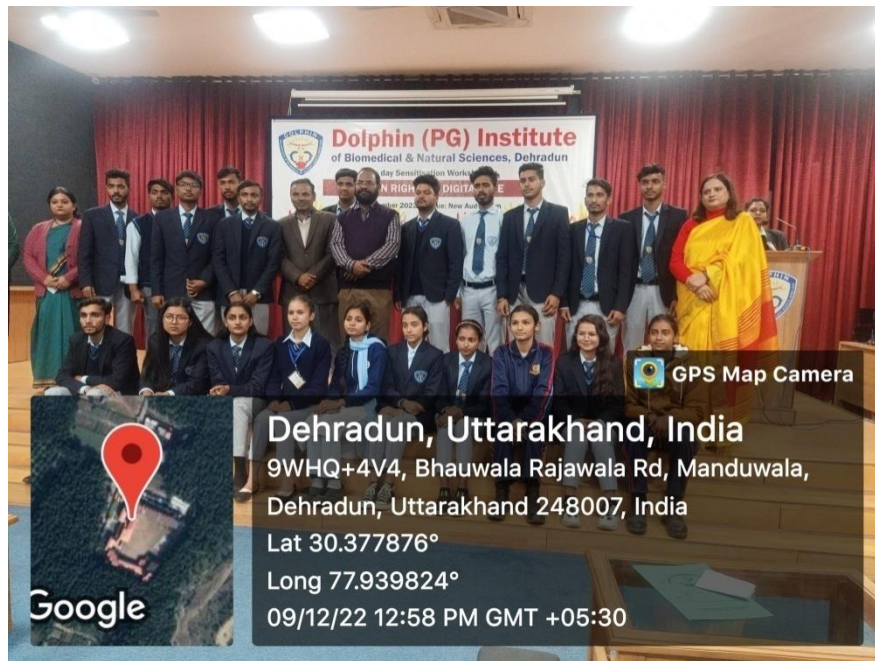
Glimpses of the Workshop